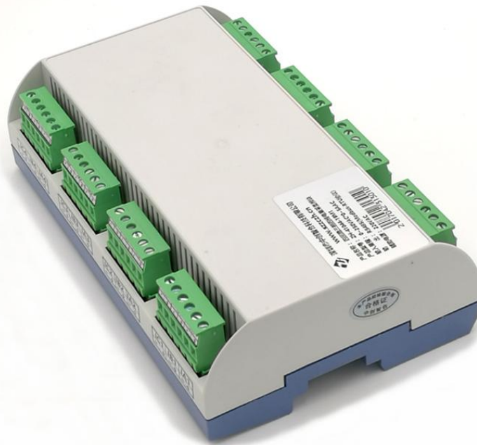
图一、产品实物图（导轨安装）