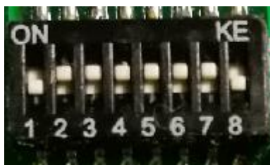
附 1: 地址码对照表

代码定义: 0--115200bps 1--9600bps 2--19200bps 3--38400bps