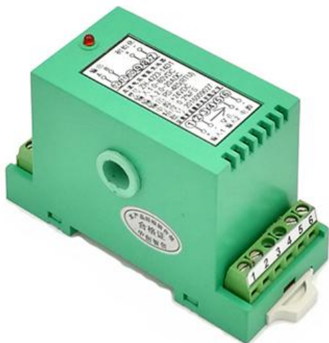
图 4.1、外观图（导轨安装）