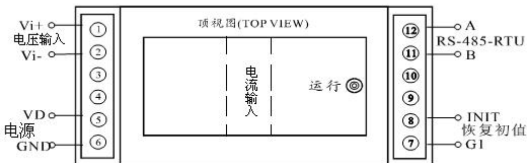
图 5.1、产品接线参考图（图为电流穿孔输入，如电流为端子输入时为 3、4 接线端子）